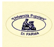
Università Popolare DI PARMA