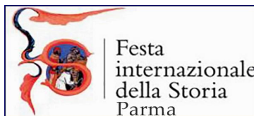
Festa internazionale della Storia Parma