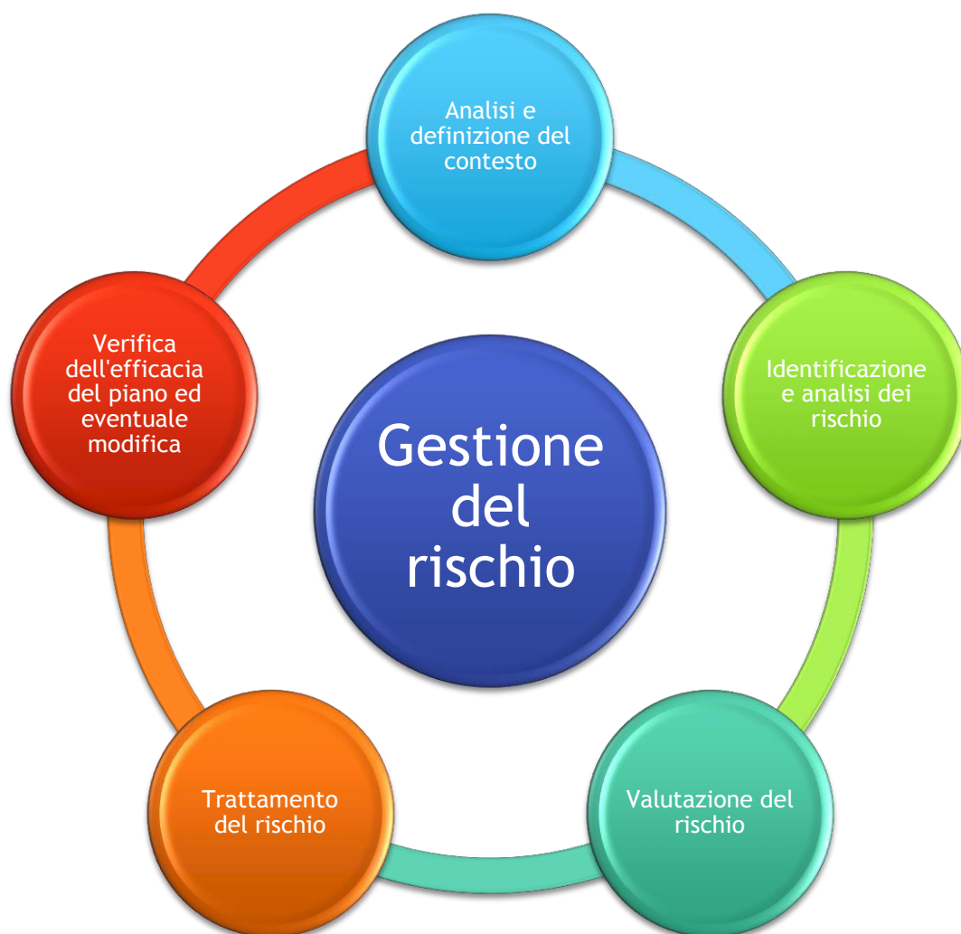
FIGURA 2 - LE FASI DEL PROCESSO DI RISK MANAGEMENT NELLE PREVISIONI DELLA LEGGE 190/2012

Il PNA, d'altro canto, come sottolineato dal relativo aggiornamento, non impone uno specifico metodo di gestione del rischio lasciando le amministrazioni libere di individuare metodologie atte a garantire lo sviluppo progressivo dell'intero complesso sistema di prevenzione; questa flessibilità, come vedremo, è particolarmente opportuna nell'ambito scolastico, che per natura e logistica si differenzia notevolmente dalla realtà ministeriale su cui è stata costruita la versione base del modello di gestione del rischio.